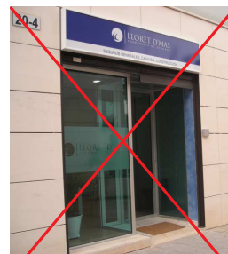
Oficinas en el Parque Empresarial.

Consciente de la evolución del sector de acuerdo con la situación económica que impera, el director técnico de Lloret D'Mas Correduría de Seguros, destaca que «hoy en día, entre los productos que más interesan, se encuentran los que tienen que ver con el ahorro y el futuro de las pensiones». A ello contribuye el clima de in-